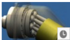
Bent-axis hydraulic motor animation and exploded view di InsaneHydraulics